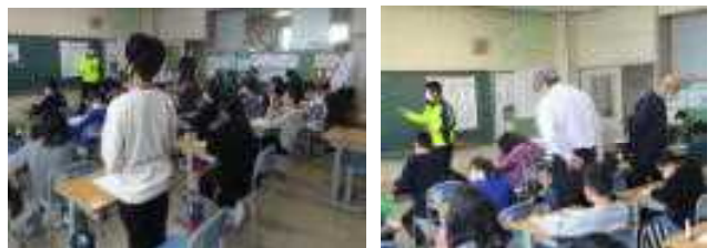
6年生：担任、教頭、専門監によるTT。一人一人をていねいに見ていました。