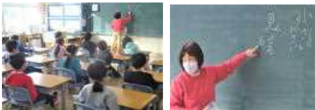
1年生：みんな集中して、聴いて、話して、考えていました。

1・2年生では漢字の学習が行われていました。間違えないポイントをみんなで考えたり、正しく身に付けることを目標に練習に励んだりしていました。姿勢よく集中している姿がありました。