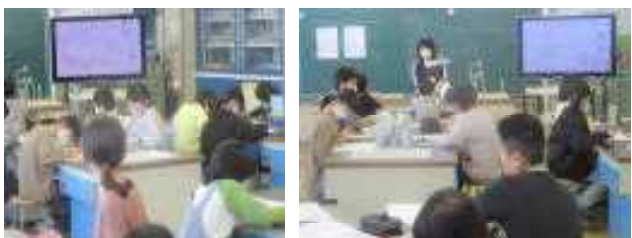
5年生：教師の手もとの資料を画面に映し、みんなで確かめていました。