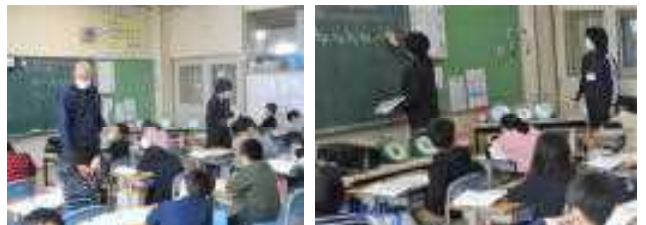
3年生：担任、教務主任、専門監によるTT。教具(秤)の準備も充実していました。

昨日は教育専門監の先生が本校で勤務する日でした。(毎週火曜日) 3・6年生では普段の2人TT(チーム・ティーチング)に先生も加わった3人でのTTが行われていました。