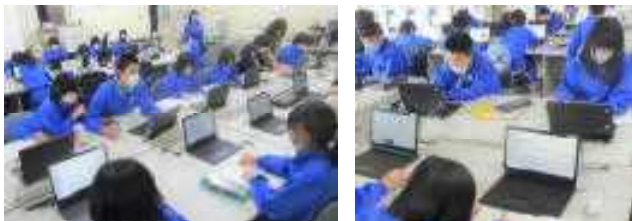
4年生：郷土の先人について、副読本にない情報を探していました。

授業では、積極的にICT(情報通信技術)や教育機器を使っています。昨日は4年生の社会科でインターネットを、5年生の理科で教材提示装置(書画カメラ)を使って学習、指導をしていました。