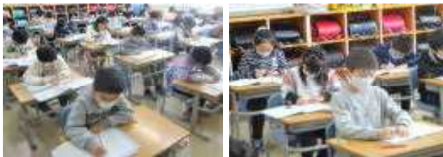
2年生：静かに集中して、美しい字で練習していました。