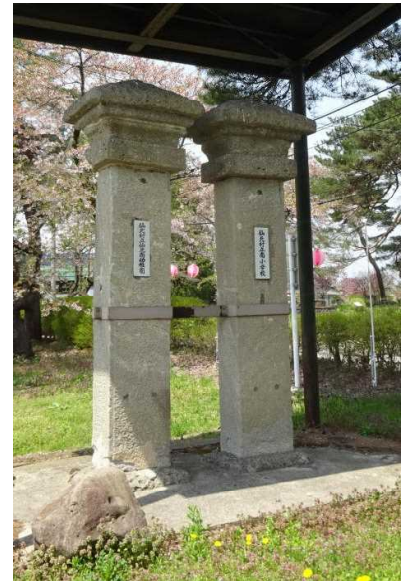
旧校門（現在の校門に入ってすぐの所にあります）

「屋根の下に大事に保存されている二本の石柱は、高梨小学校最初の貴重な正門です。明治40年5月20日に新築校舎が落成しましたから、この校門もそれを記念して建てられたのでは無からうかと思われています。門の石材は近くの「金沢石」だろうと言われていています。」（平成6年 仙北町教育委員会作成 校門由来より）