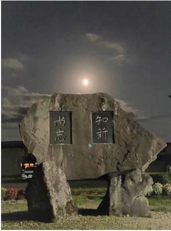
中秋の名月と校訓碑

高梨小学校で暮らす子どもたちには、「思いやりの心」をもち、「正しい行い」を守り、「進んで勉学に励む」人になってほしいと思います。