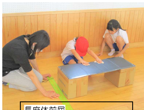
長座体前屈 (体の柔軟性を測ります)