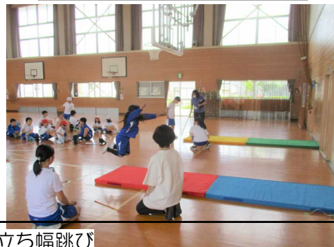
立ち幅跳び (両足ジャンプで、飛んだ距離を測ります)