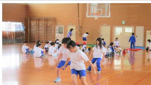
反復横跳び (1メートル間隔の3本の線を、20秒間往復し、何回通過できたかを数えます)