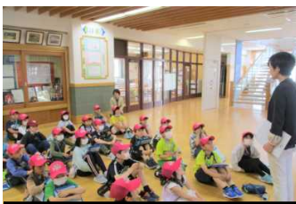
出発前に最終確認です。

4つのグループに分かれて、午前中の3～4校時の時間帯にまちたんけんに出かけました。行き先は、『四ツ屋タクシー、四ツ屋郵便局、手作りハウスふらっと、ヘア・モードMOGA』です。この日は天気もよく、皆さん探検バックと水筒を持参して元気に歩いて行ってきました。どんな仕事をするのかなど、いろいろ質問をして勉強してきました。あいさつも（事前に大分練習しましたが）素晴らしかったです。