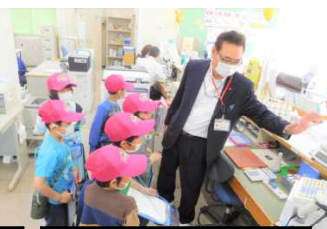
四ツ屋郵便局さん