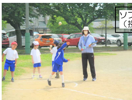
ソフトボール投げ (投げた距離を測ります)