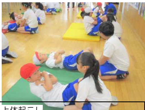
上体起こし (30秒間でできた回数を数えます)

「新体力テスト」の理解が深まり、「新体力テスト」が有意義に活用され、ひいては21世紀の社会を生きる人々が心身ともに健康で活力ある社会を営んでいくことを期待いたします。