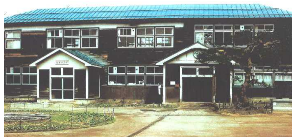
松倉小学校（平成13年四ツ屋小に統 合）