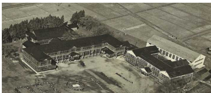
現在の場所の校舎（右側は四ツ屋中学校） 合）