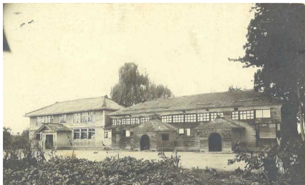
現在の3区神明社付近にあった校舎