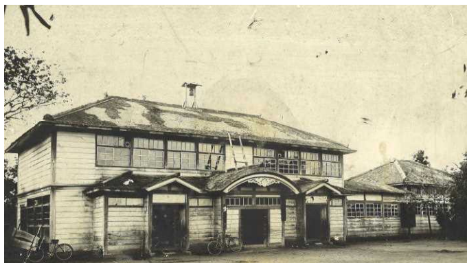
高関尋常小学校(大高神社の付近にあった)