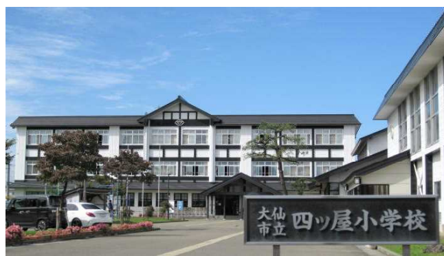
現在の校舎（平成16年落成）