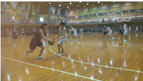
バスケットボール大会の様子

各部とも善戦しましたが、上位進出はなりませんでした。夏の本番に向けて、更なる努力と研究を重ねてほしいと思います。