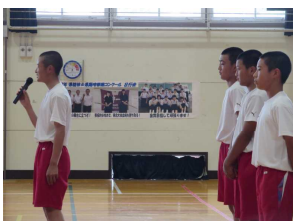
壮行会 陸上メンバー