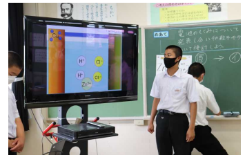
7日、3年生理科の授業