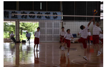
8日、1年生体育の授業