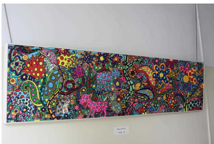
作品名 「flower & animals」