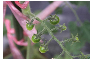
トマトはこのように実ります