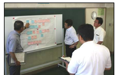
授業後に、先生方で、授業研究会（反省会）を行いました。