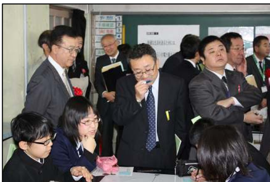
参観の先生もペンを持って一緒に（2年）