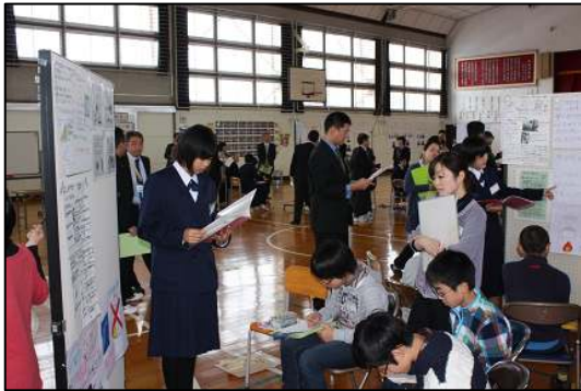
パネルを使ってプレゼン（1年）