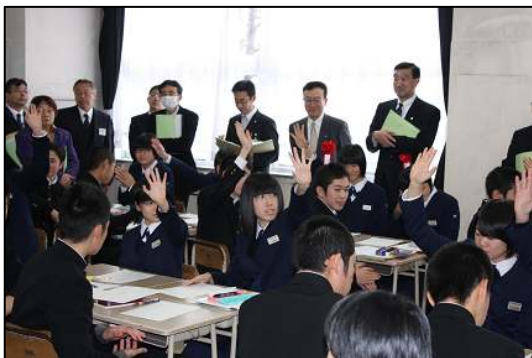
挙手する手がまるで林のよう（3年）