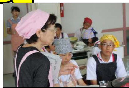
説明をきちんと聞いて…