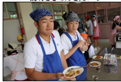
このように美味しく…