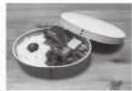
曲げわっぱの弁当

アメリカのボックスランチやフランスのカスクールトなど、日本の弁当のように戸外に持ち出して食べることもできる食事は、昔から各国にあり、それぞれの国で愛されています。そのような中、日本の弁当が海外の様々なメディアで取り上げられたり、国際的な弁当のコンクールが開催されたりしています。私たちの身近にあり、特別なものではない弁当が、今、海外 のデパートの食料売り場でも、おしゃれでカラフルな弁当箱がたくさん売られています。さらに、料理をおいしく食べるための優れた機能をもつ弁当箱もあります。例えば、「曲げわっぱ」という木製の弁当箱は、木が湿気を吸うので料理が腐りにくく、食べ物の風味が保たれるという利点があります。美しい木目や色合い、木の香りなども楽しめる「曲げわっぱ」は、海外でも広く知られています。 弁当は、単かのために作ったり、皆で持ち寄って和気あいあいと食べたりすることもあります。こうした