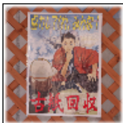
協力を呼びかける海舟くん