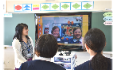
教室の後ろに日本語のカードが見えます