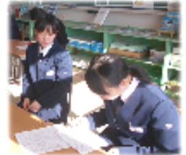
自分の番まで火死に練習

これがツボ？ “What’s your hobby?”（オーストラリアの生徒の質問）に対して、“I like sleeping.”（南中生）と答えたところ、ツボに入ったのか、やたらと受けていました。また、男子生徒のグループが登場したら、女子生徒がドッと画面前に…。授業中ですよ！