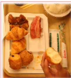
ある人の印象深い朝食