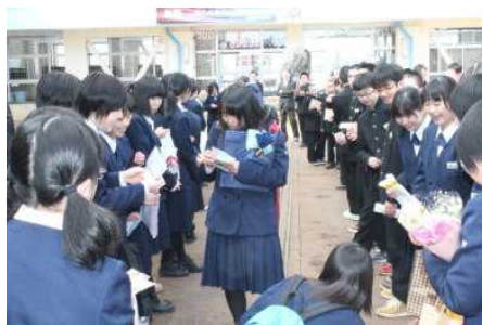
花道で後輩達と最後の別れを惜しむ卒業生